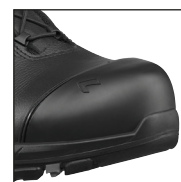
HAIX® Composite toe cap