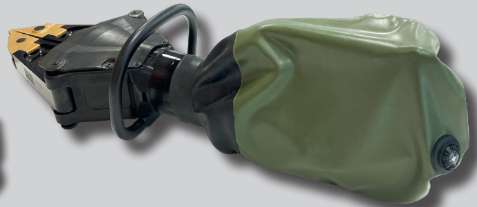
* IP-BAG LARGE, ID 1101497